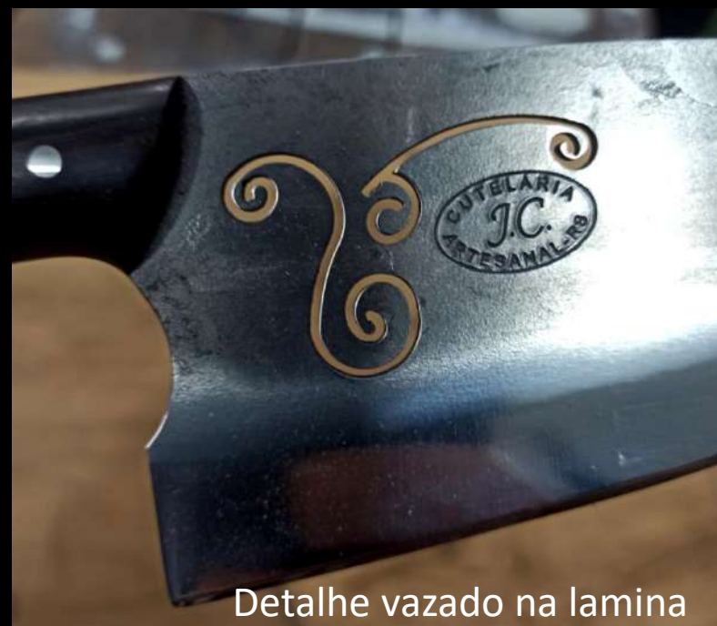
Detalhe vazado na lamina