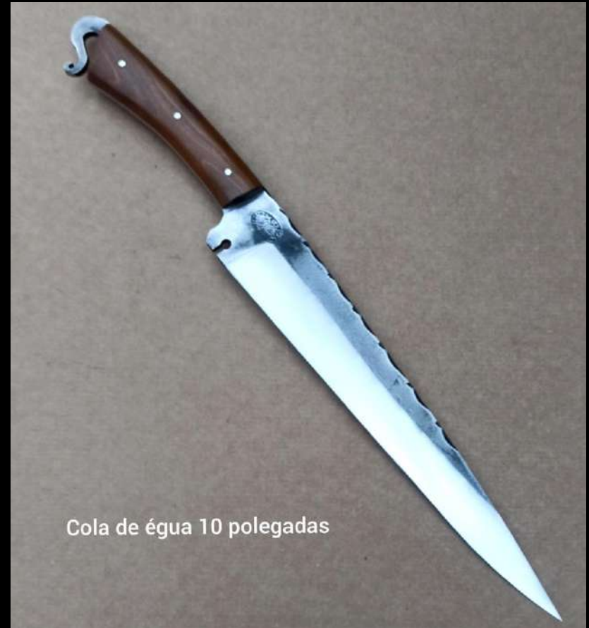
Cola de égua 10 polegadas

O modelo cola de égua também está disponível em aço inoxidável 3,0mm